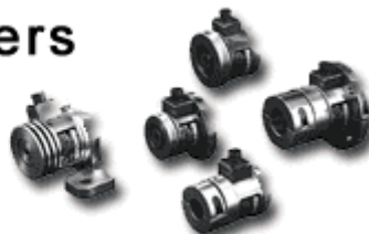
Celdas de carga

Cygnus, Versatec, Ultrasonic sensor US-2,Trac-3, Trac-4, DFC-90, DFC-A, Fad, TC5/TC-5P, PS-90, IPT-E, IPT, IP-80, DFP, DFP-2, Power amplifiers, Celda de carga, TS, load cells, CL, LC-500G, GTS, TSU, DTR, TR-5, TSA, IS-2, DDB, DDB-9, DDB-13, DDB-17, C-1, C-3, C-10, C-50, C-100, GCA, GCB, GCC, GCD, GBA, GBB, GBC, GBD, B-5, B-25, B-50, B-7V & B-20V. brake, clutch.